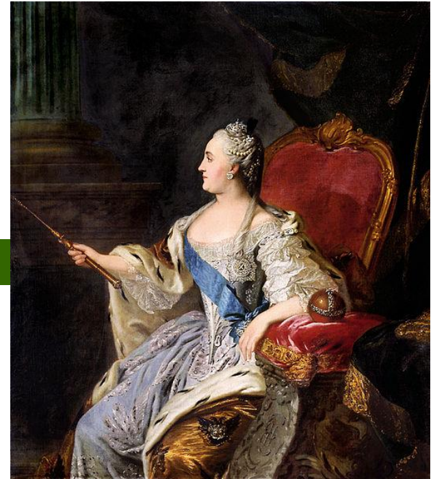
Kateřina II. Veliká