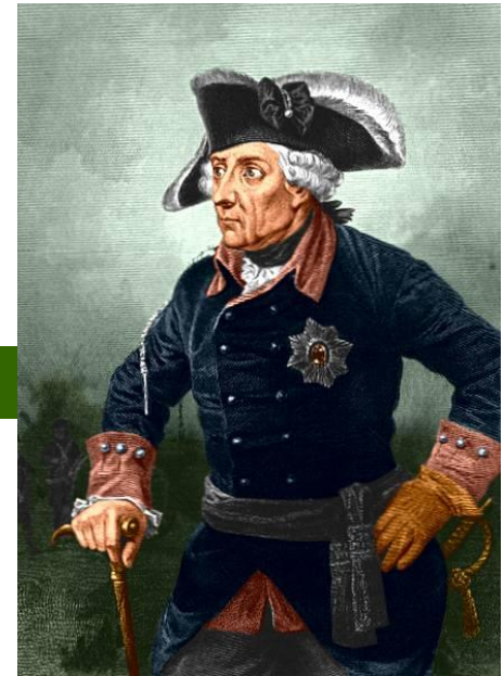
Fridrich II. Veliký