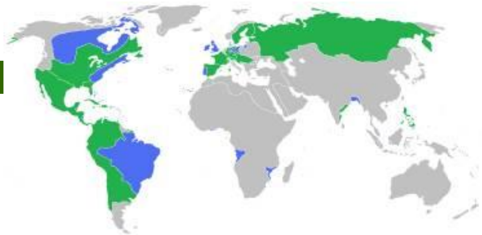
Země zapojené do 7leté války; spojenci Pruska; spojenci Habsburků