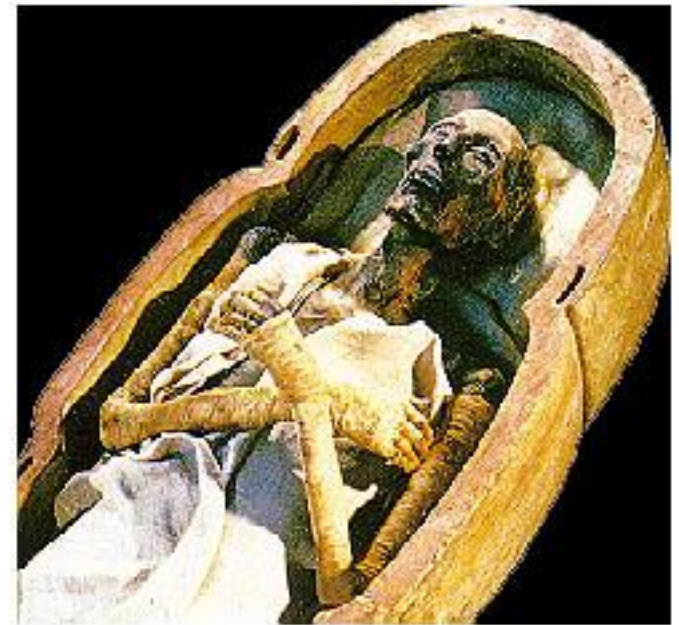
Mumie Ramesse II.