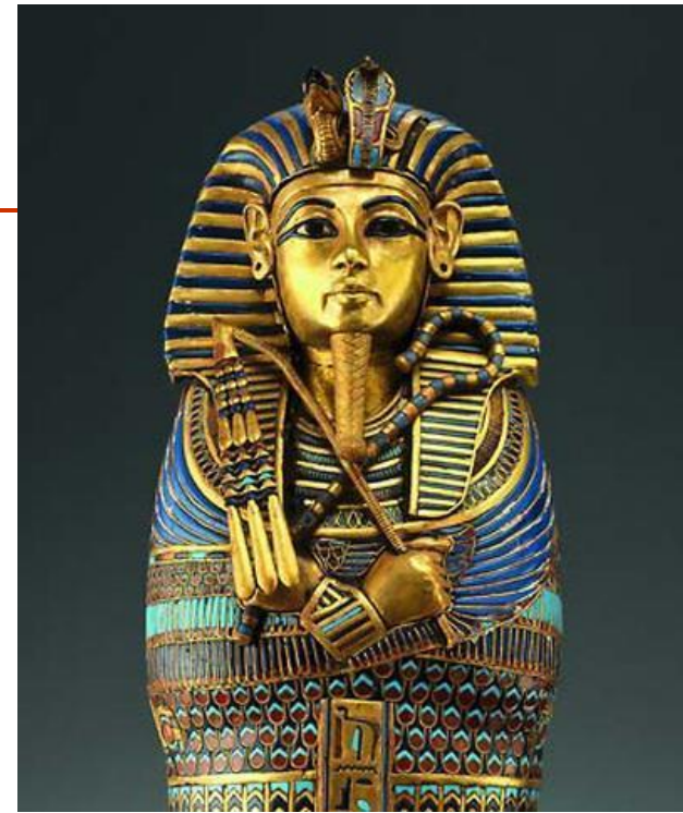
Klasické vyobrazení faraona